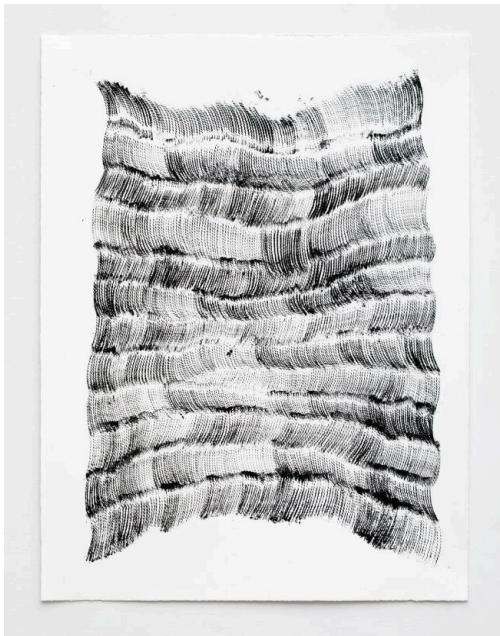
Lynne Tobin, Threads #4 2023, ink on paper, 24"H x 18"W | 61 cm x 45.75 cm