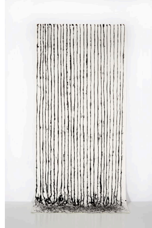
Lynne Tobin, Black Rain , 2017 ink on paper 96"H x 42.5"W | 244 cm x 108 cm