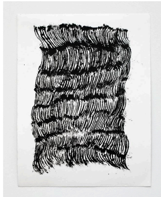
Lynne Tobin, Unstrung 2023, ink on paper 15"H x 11.5"W | 38 cm x 29.25 cm