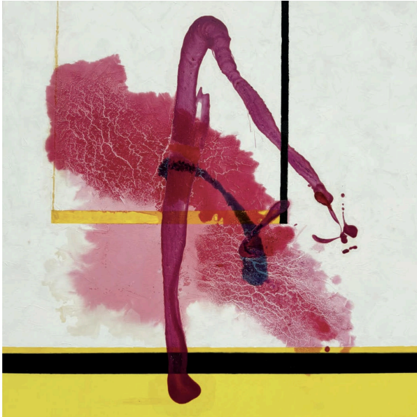
Fred Duignan, The Swing , 2025, oil on canvas, 36" x 36" inches | 91.5 x 91.5 cm

Fare un clic sull'immagine o il nome d'artista per una risoluzione più elevata