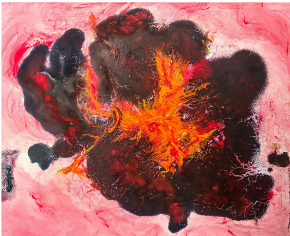
Fred Duignan, Witness , 2018, oil on canvas, 18" x 22" | 45.5 x 55.75 cm